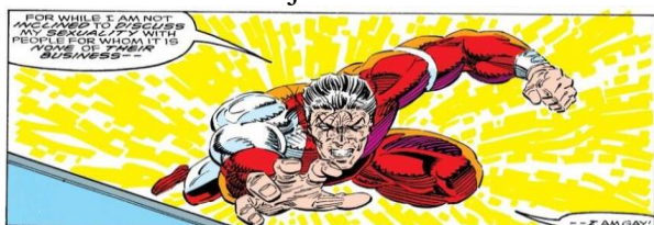
Figura 1: Estrela Polar se declarando gay durante a epidemia de AIDS dos anos 90.

A Tropa Alfa resolve usar o caso da bebê para conscientizar a população da importância dos cuidados para se combater a epidemia de HIV. Logo, isso vira notícia. Mas nem todos estariam felizes. Major Mapleleaf, um herói da Era de Ouro, resolve atacar o hospital e matar a criança. Logo, ficam claros seus motivos: seu filho era gay e foi infectado com o vírus, vindo a falecer. A fim de salvar a menina, Estrela Polar começa a socar o Major, enquanto proclama um discurso tentando trazer o herói de volta a si. No meio desse discurso, Estrela Polar diz que é gay, apesar de não querer que sua sexualidade seja motivo de discussão.