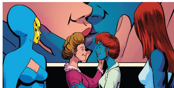
Figura 2: O primeiro beijo de Sina e Mística nas HQs.

Todavia, o fato de terem lançado Estrela Polar como o grande ícone gay da Marvel na década de 90 não significou que outros personagens que possuíam momentos de queerbaiting puderam se assumir. Uma das personagens que ficou negligenciada todos esses anos foi Kitty Pryde (Lince Negra), que só recentemente foi confirmada como bissexual. A primeira aparição da Lince Negra foi em janeiro de 1980, ainda durante o período de restrições à personagens LGBTQIA+. Apesar de muitos se lembrarem de seu relacionamento com Pyotr “Peter” Rasputin (Colossus), é importante enfatizar duas personagens que sempre pareceram surgir como interesses amorosos de Kitty: Illyana Rasputin (irmã de Colossus e companheira de quarto de Kitty na Mansão Xavier) e Rachel Summers. Esta última foi indicada pelo criador da Lince Negra, Chris Claremont, como seu verdadeiro amor 29 .