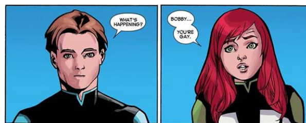
Figura 3: Polêmico diálogo em que Jean Grey tira Bobby Drake do armário 36 .