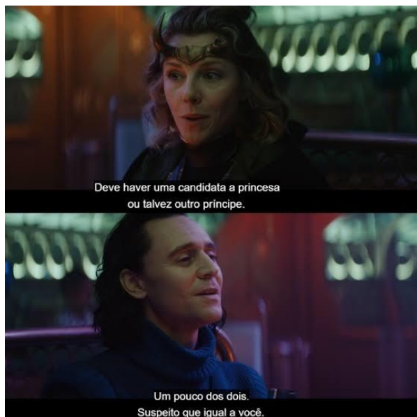
Figura 4: O uso da “bissexual lighting” durante a conversa de Loki com a Lady Loki, na qual Loki admite sua bissexualidade.

ainda que a primeira aparição da Lady Loki tenha sido em 2008 45 ), essa revelação provocou um choque para aqueles que consomem somente os produtos da Marvel gerados através do UCM.