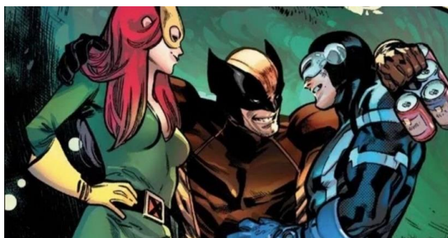
Figura 6: Jean, Wolverine e Ciclope em momento descontraído.