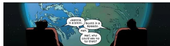
Figura 7: Momento de queerbaiting entre Wolverine e Ciclope. 51

Analisando fóruns online de fãs da Marvel , a principal crítica do público conservador sobre essa relação poliamorosa é que abre brecha para Ciclope e Wolverine serem bissexuais 49 . Apesar de alguns defenderem que já havia insinuações nos quadrinhos de que os personagens poderiam ser LGBTQIA+, tais referências são extremamente sutis e incipientes para formar uma opinião mais respaldada. A maioria dos fãs parece acreditar que tal característica é incoerente com esses personagens, especialmente com Wolverine e seu ar de “lenhador” 50 símbolo da masculinidade”.